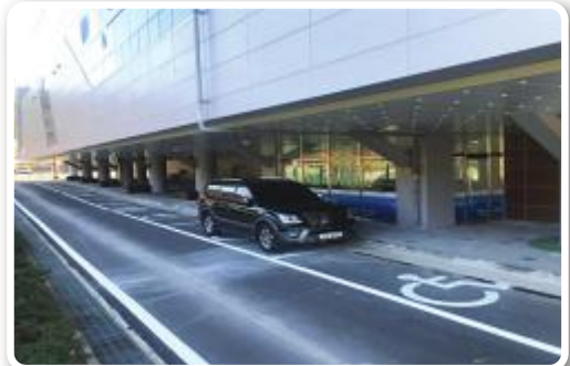
장애인전용주차구역 설치 후

장애인국민체육센터는 11월 27일부터 12월 13일까지 장애인 주차구역을 총 8면 증설 하여 이용객들의 편의 향상을 도모하였습니다.