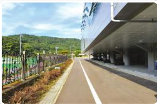
장애인전용주차구역 설치 전