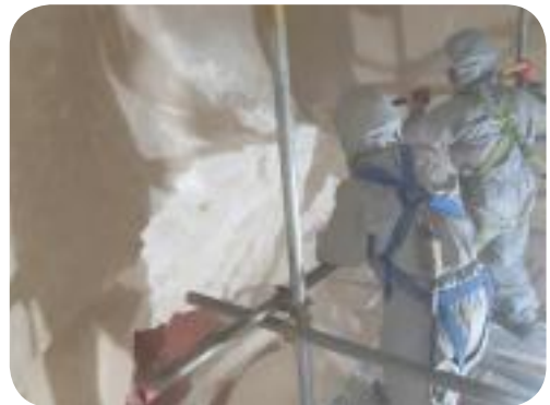
소각시설 세정공사 완료

장기간 24시간 연속 가동운전으로 소각시설 내·외부의 정비가 필요하여 21일간(5월8일~5월28일)의 상반기 정기유지보수를 당초 계획에 따라 정상적으로 실시완료하였습니다.