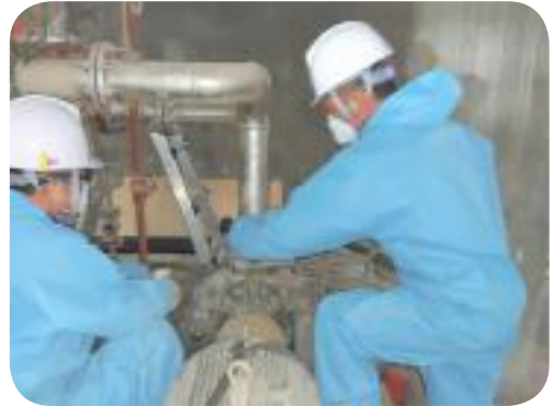
보일러 급수펌프 교체공사 완료