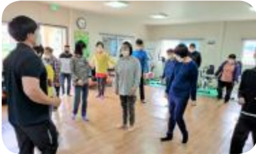
체력측정 및 운동처방