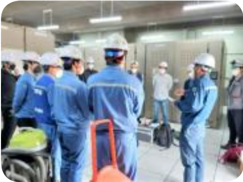
전기설비 점검 보수 완료