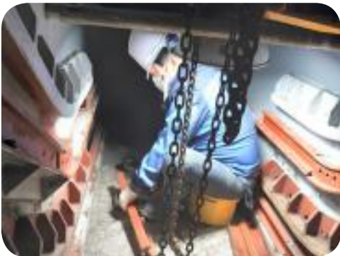
바닥재 반출설비 설치공사 완료